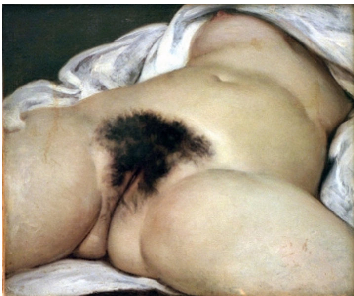
L'origine di Monde, 1866

L'opera offre la vista delle gambe aperte di una donna nuda mostrando un ciuffo di peli neri attorno